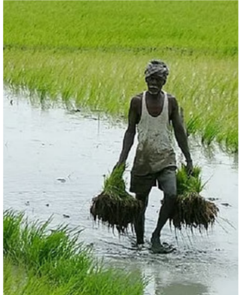
వ్యవసాయానికి తప్పని యుద్ధం సెగ

ప్రస్తుతానికి పరిస్థితి అంతోడనకరంగా ఉన్నప్పటికీ, మే చివరిలో ఐఎండీ విడుదల చేసే సవరించిన నివేదిక కోసం నిపుణులు వేచి చూస్తున్నారు. గతంలో తొలి అంచనాలకు, వాస్తవ వర్షపాతానికి మధ్య వ్యత్యాసాలు ఉన్నప్పటికీ, ఆధునిక సాంకేతికత వల్ల ఇప్పుడు ఆ తేడా తగ్గిపోయింది. సగటున 87 సెం.మీ. కురవాలిని వర్షం ఈసారి 80 సెం.మీ.కి వరిమితమైతే, అది దేశ జీవీపీ గణాంకాలపై, గ్రామీణ ప్రజల కొనుగోలు శక్తిపై తీవ్ర ప్రభావం చూపుతుంది. ముఖ్యంగా ఉద్యానవన పంటలు, పొగాకు, రబ్బరు వంటి వాణిజ్య పంటలు కూడా ఈ ప్రభావాన్ని చవిచూడవచ్చు.