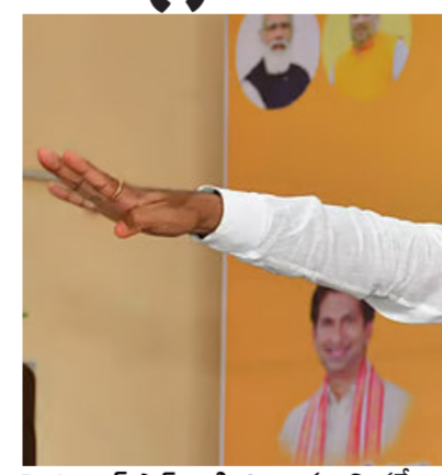
హైదరాబాద్, ఢిల్లీ ఇండియా : ప్రధాని నరేంద్ర మోదీని ఉద్దేశించి విజయ్ బిష్ మల్లికార్జున ఖర్గే చేసిన 'ఉగ్రవాది' వ్యాఖ్యలపై కేంద్ర మంత్రి బండి సంజయ్ ఆగ్రహం వ్యక్తం చేశారు. ప్రధాని మోదీని టెర్రర్లిజం అని పిలవడం రాజకీయమే కాదు ఓటమిని అంగీకరించలేని నైరాశ్యం అని ధ్వజమెత్తారు. ఇలాంటి మాటలు

మోడీకి పదే పదే మద్దతు తెలిపిన ఓటర్లను అవమానించడమేనన్నారు. ఈ మేరకు ఇవాళ ఎక్స్ వేదికగా బండి సంజయ్ ఓ షోషు చేశారు. హస్తాంతో మ్యాప్.. కూసుమంచి మండలం మోటాపురం సర్వే నం.156/బి1 లో గల ఒక 1.04 ఎకరాలను నేలకాండపల్లి మండలం ముత్తాపురం గ్రామానికి నిబంధనను భూ భారతి చట్టంలో అనే రైతు పొందపరిచామని, అదే విధంగా ఎవరైనా