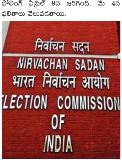
పోలింగ్ ఏప్రిల్ 9న జరిగింది. మే 4న ఫలితాలు వెలువడతాయి.