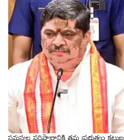
సమస్యల పరిష్కారానికి తమ ప్రభుత్వం కట్టుబడి ఉందని మంత్రి పొన్నం ప్రభాకర్ పేర్కొన్నారు. కమిటీ ఏర్పాటు చేస్తూ ప్రభుత్వం ఉత్సాహం వ్యక్తం చేశారు. ఆర్టీసీ కార్మికుల సమస్యల పరిష్కారంపై మంత్రి పొన్నం ప్రభాకర్ పేర్కొన్నారు. కమిటీ ఏర్పాటు చేస్తూ ప్రభుత్వం ఉత్సాహం వ్యక్తం చేశారు. ఆర్టీసీ కార్మికుల సమస్యల పరిష్కారంపై మంత్రి పొన్నం ప్రభాకర్ పేర్కొన్నారు.

హైదరాబాద్, ఢిల్లీ ఇండియా : తెలంగాణ ఆర్టీసీ కార్మికుల సమస్యల పరిష్కారంపై తమ ప్రభుత్వం సానుకూలంగా ఉందని మంత్రి పొన్నం ప్రభాకర్ స్పష్టం చేశారు. తమ ప్రభుత్వం నిర్ణయాలు తీసుకునే అంశంలో కొంత జాప్యం జరిగి ఉండవచ్చని తెలిపారు. ఆర్టీసీ కార్మికులు లేవనెత్తిన అన్ని అంశాలను పరిశీలించడానికి నలుగురు అధికారులతో ఒక కమిటీ ఏర్పాటు చేసినందుని ప్రస్తావించారు. ఆర్టీసీ ప్రతినిధులంతా ఆ కమిటీకి కార్మికుల సమస్యలు విన్నవిస్తే ఉప ముఖ్యమంత్రి మల్లు భట్టి విక్రమార్కు, తాను అధికారుల దగ్గర చర్చించి సమస్యలు పరిష్కరిస్తామని చెప్పుకొచ్చారు. ఉద్యోగులుగా మీరు.. ప్రభుత్వంగా తాము కలిసి పనిచేద్దామని ఆ కమిటీకి కార్మికుల సమస్యలు విన్నవించాలని సూచించారు. ఆయా