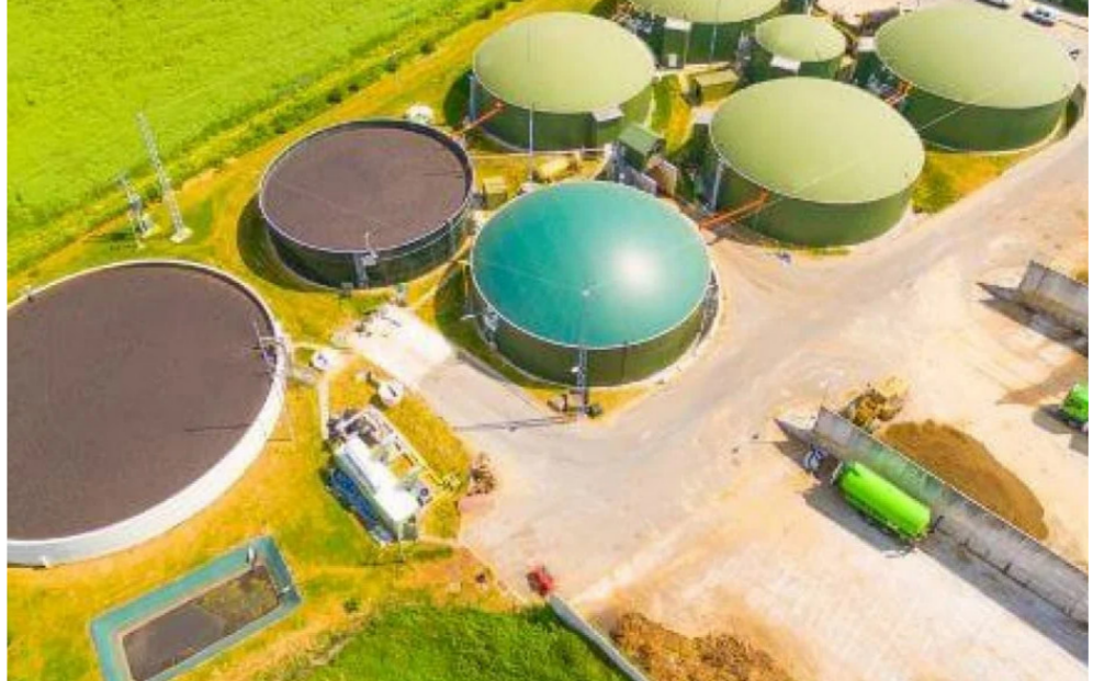
వ్యవసాయ రంగంలో విప్లవాత్మక మార్పులు వస్తున్నాయి.

నిన్నటి వరకు అనవసర వ్యర్థంగా, కాలుష్య కారకంగా భావించిన వరిగడ్డి, ఇప్పుడు రైతులకు అదనపు ఆదాయ వనరుగా మారుతోంది. తెలంగాణ ప్రభుత్వం, జాన్ బూల్ బయో ఫ్యూయల్స్ ప్రైవేట్ లిమిటెడ్ సంయుక్తంగా చేపట్టిన భారీ కంప్లెక్స్ బయోగ్యాస్ ప్రాజెక్టుతో తెలంగాణ ఇంధన రంగంలో సరికొత్త చరిత్రను లిఖించబోతోంది. సిద్దిపేట జిల్లా నారాయణరావుపేట మండలం నర్మెట్ల పారిశ్రామిక ప్రాంతంలో ప్రారంభమైన ఈ ప్రాజెక్టు, వరిగడ్డిని 'బంగారం'గా మార్చబోతోంది. రాష్ట్ర పారిశ్రామిక, బడి శాఖ మంత్రి దుద్దిక్ తీర్థర్ బాబు, మాజీ మంత్రి హరీష్ రావు నమిస్తూ భూమిపూజ జరుపుకున్న ఈ ప్రాజెక్టు