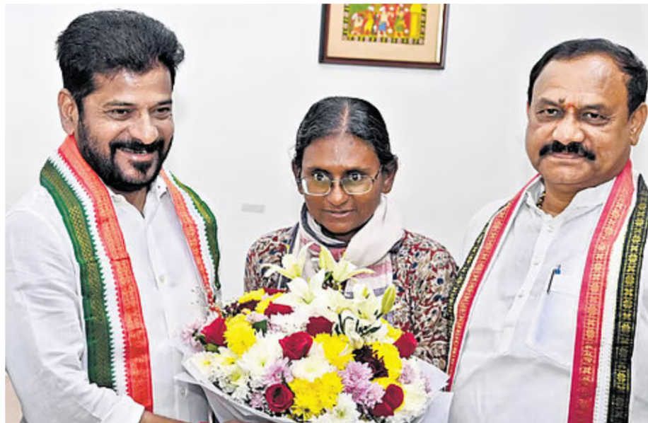
హైదరాబాద్, ఫ్లాష్ ఇండియా :

ముఖ్యమంత్రి రేవంత్ రెడ్డితో కాంగ్రెస్ రాష్ట్ర వ్యవహారాల ఇంఫార్మ్ మీనాక్షి నటరాజన్, టీపీసీసీ అధ్యక్షుడు మహేశ్ కుమార్ గౌడ్ బుధవారం ఉదయం సమావేశమయ్యారు. మధ్యాహ్నం వరకూ ఈ భేటీ కొనసాగింది. ప్రధానంగా నామినేటివ్ పదవుల భర్తీ, నియోజకవర్గాల పునర్విభజన, పార్టీ అంతర్గత వ్యవహారాలపై కీలకంగా చర్చించినట్లు తెలుస్తోంది. దేశవ్యాప్తంగా జరగనున్న నియోజకవర్గాల పునర్విభజన వల్ల తెలంగాణ వంటి దక్షిణాది రాష్ట్రాలకు రాజకీయంగా నష్టం కలిగే అవకాశం ఉందన్న అంశంపై ప్రధానంగా చర్చించారు. జనాభా ప్రాతిపదికన మాత్రమే సీట్లను పెంచితే, అభివృద్ధి పథంలో ఉన్న తెలంగాణకు అన్యాయం జరుగుతుందని, దీనిపై పార్టీ పరంగా చేపట్టాల్సిన పోరాటాలు, ప్రజా క్షేత్రంలోకి తీసుకెళ్లాలని అంశాలపై ప్రణాళికలు సిద్ధం చేయాలని సీఎం రేవంత్ రెడ్డి సూచించినట్లు సమాచారం. అలాగే.. దక్షిణాది రాష్ట్రాల ప్రాతినిధ్యం తగ్గకుండా ఉండేందుకు సీఎం ప్రతిపాదించిన 'హైబ్రిడ్ మోడల్' పై కూడా చర్చ జరిగినట్లు తెలుస్తోంది. నామినేటివ్ పదవుల భర్తీ చాలా కాలంగా పెండింగ్లో ఉన్న నామినేటివ్ పదవుల భర్తీ ప్రక్రియను వేగవంతం చేయాలని ఇర-వురు నేతలు నిర్ణయించారు. పార్టీ కోసం కష్టపడిన కార్యకర్తలకు, ఎన్నికల సమయంలో చురుగ్గా పనిచేసిన వారికి సముచిత స్థానం కల్పించాలని మీనాక్షి నటరాజన్ కోరారు. ఇప్పటికే పదవుల్లో ఉన్న కార్పొరేషన్ చైర్మన్ల పనితీరును బేరీజు వేసి, వారి పదవీకాలం పొడిగింపు లేదా కొత్త వారి నియామకంపై ప్రాథమికంగా ఒక అవగాహనకు వచ్చారు. వారంలో పీఎస్ సమావేశం రాష్ట్రంలో మారుతున్న రాజకీయ